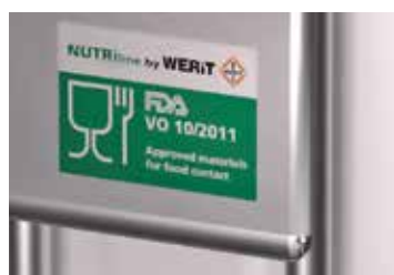
Označení FDA, VO 10/2011