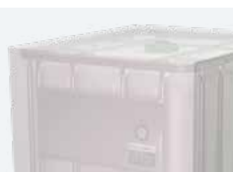
Sello Lámina de aluminio