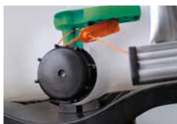
Válvula precintada El precinto se puede retirar sin herramientas