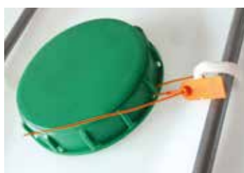
Tapa con precinto El precinto se puede retirar sin herramientas